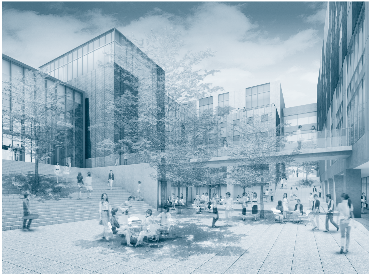
2017年度竣工 武蔵野音楽大学江古田新キャンパス イメージ図